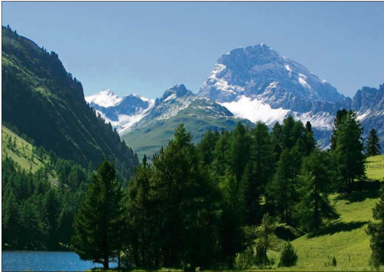
Il Piz Ela dat il num al pli grond parc natiral da la Svizra.

Il vitg musical: Ernen cun ses festival da clavazin e ses festival da musica barocca e da chombra è daventà enconuschent lunsch suror ils cunfins nazionals. Quest