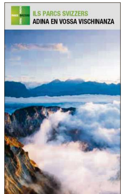
La charta uffiziala porscha infurmaziuns cumplexivas davart ils singuls parcs.

In mund per sai è la regiun idillica da la Val Müstair. Prada bella verda e vitgs pittorescs stattan en cuncontrast cun la natira selvadia dal Parc Nazional da l'autra vart dal Pass dal Fuorn. La cuntrada singulera è vegnida undrada gist duas giadas: La Val Müstair vala il medem mument sco parc natiral regiunal e sco part dal reservat da biosfera autalpin da l'Unesco Val Müstair – Parc Nazional Svizzer. Ina vista spezialmain bella sin il paradis da quietezza pon ins giudair sin la «Senda Val Müstair» che maina aut sur la val tras guauds da schembers, pastgiras alpinas e prads da flurs.